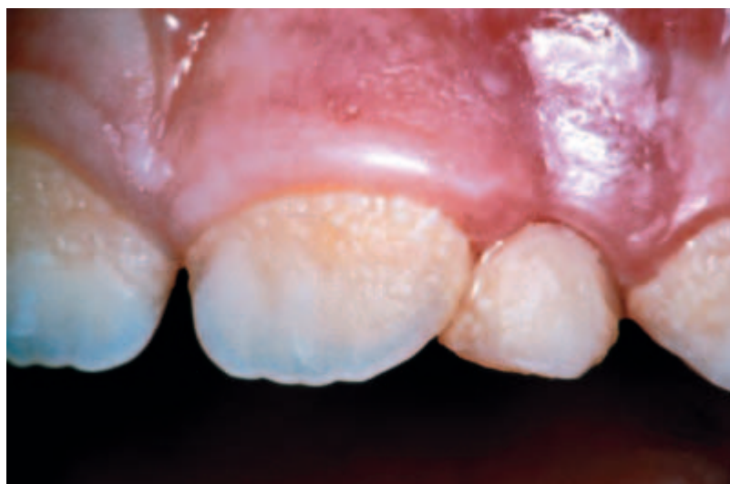
Abbildung 5 Ausgeprägter Plaquebefall an den oberen Frontzähnen

Mütterberaterinnen und Pädiater sind die einzigen Fachpersonen, die prak-