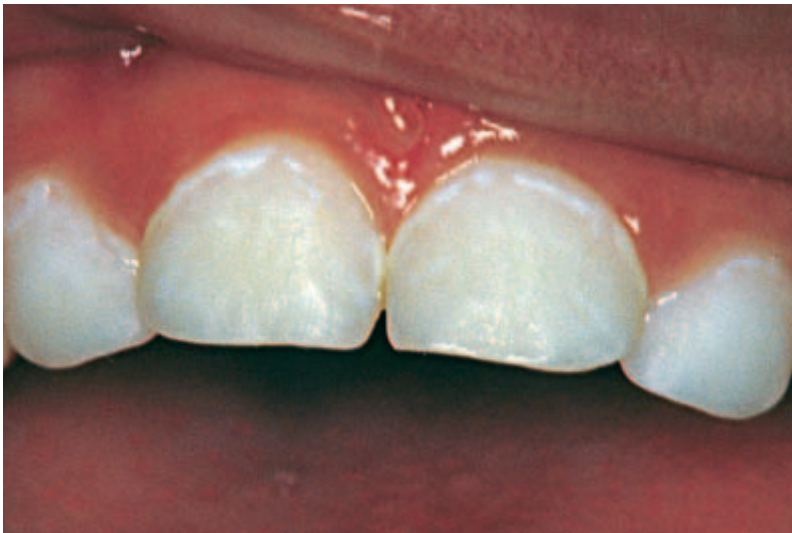
Abbildung 3 Initiale kariöse Läsionen (d1) entlang des Zahnfleischrandes