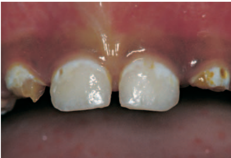
Abbildung 4 Fortgeschrittene kariöse Läsionen mit Kavitation (d2) an den oberen seitlichen Schneidezähnen

ner Beteiligung von 78% entspricht. Das mittlere Alter betrug 2.40 Jahre (2.06 bis 2.90). Die Eltern von 47 Kindern verweigerten die Untersuchung, und nur gerade sieben Kinder ließen sich nicht untersuchen. Die prozentualen Anteile der teilnehmenden